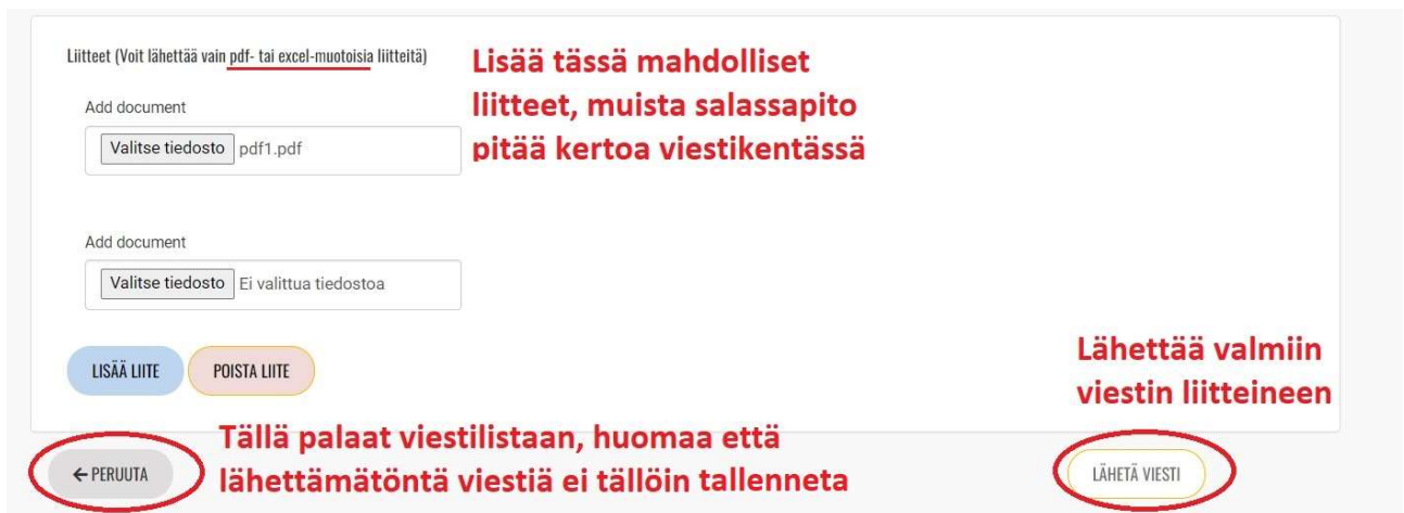
Kuva 6. IRT:n käyttöliittymän esimerkkikuva 2